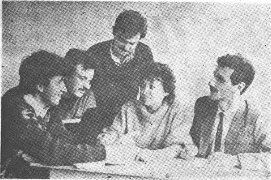
ПРО ТЕ, ЩО ХВИЛЮЄ