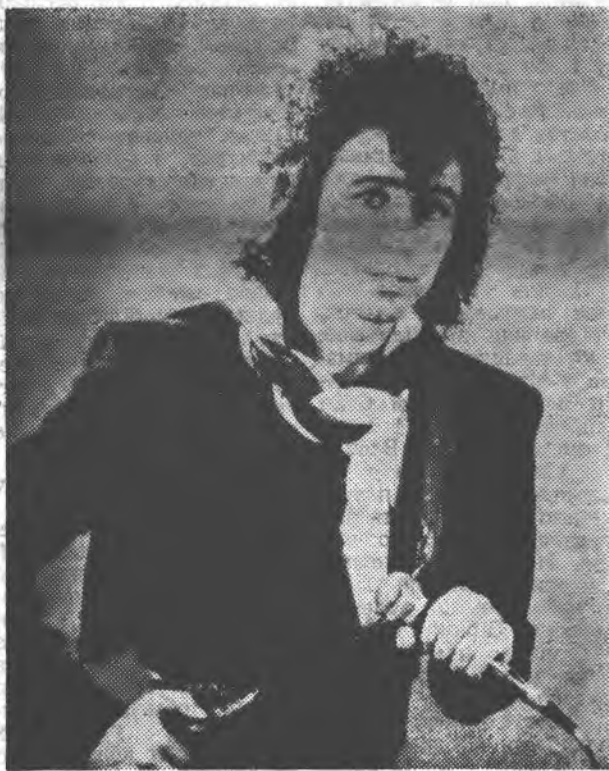
На знімку: популярний естрадний співак, заслужений артист УРСР ВАЛЕРІЙ ЛЕОНТЬЄВ.